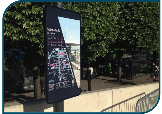
Signalétique à la sortie du RER B La Plaine Stade de France